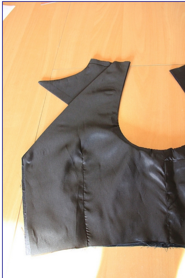
Zoom sur l'intérieur d'un côté dos