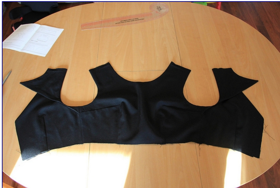
Vue de l'extérieur du vêtement