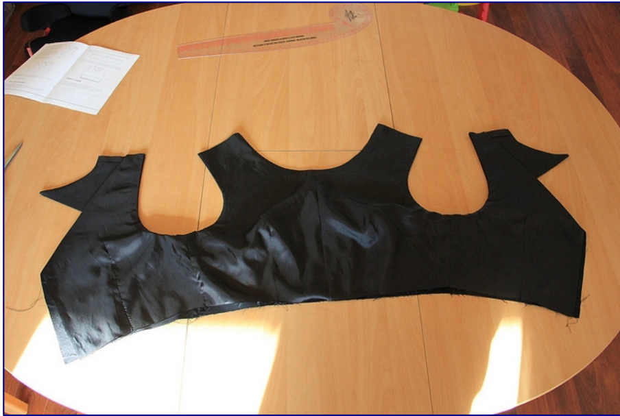
Vue de l'intérieur du vêtement